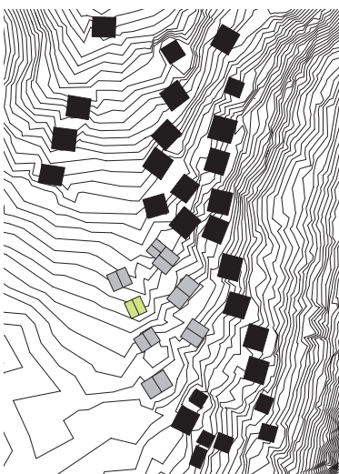
Das Haus mit umgebenden Neubauten.