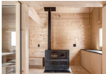
Geheizt wird mit einem Specksteinofen.