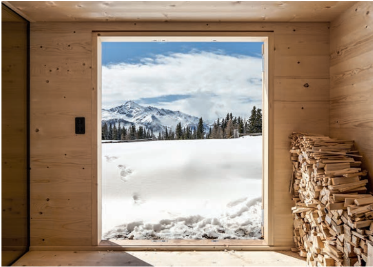
Der Vorraum vermittelt zwischen innen und aussen.