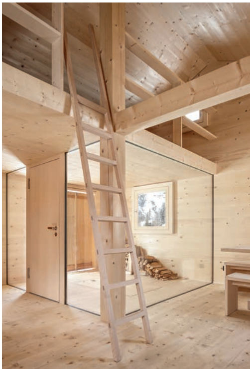
Eine Stütze teilt den Raum in vier Quadrate auf.