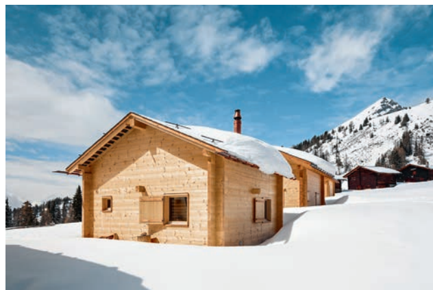
Der wohlproportionierte Strickbau wendet die Giebelseite dem Tal zu.